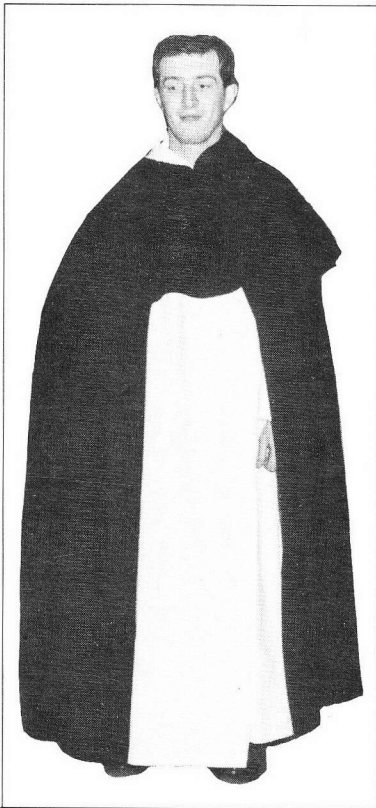
Costume de Dominicain, conservé au Couvent des Dominicains, à Liège. Ce costume n'a pas varié depuis le moyen âge.

Les ordres mendiants sont fortement organisés; ils sont hiérarchisés à plusieurs niveaux. Les Dominicains sont gouvernés par un maître général; les Franciscains, par un ministre général. Carmes et Dominicains suivent les règles canoniales existantes; saint François, par contre, dote son ordre d'une règle originale.